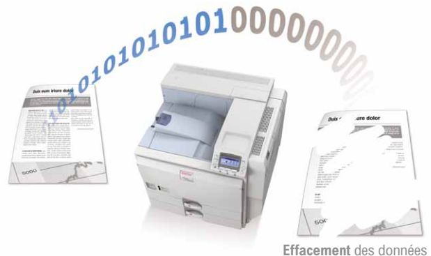
Effacement des données